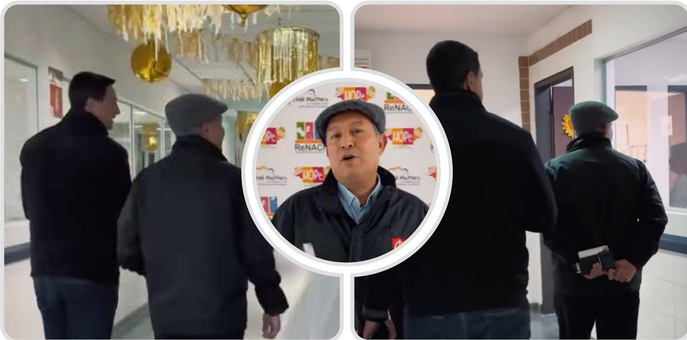
VISITA A LA FUNDACION RENACI Y HOSPITAL DEL CÁNCER