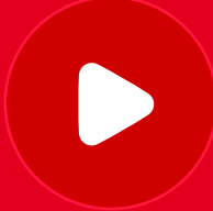
LINK VIDEO DE LA VISITA