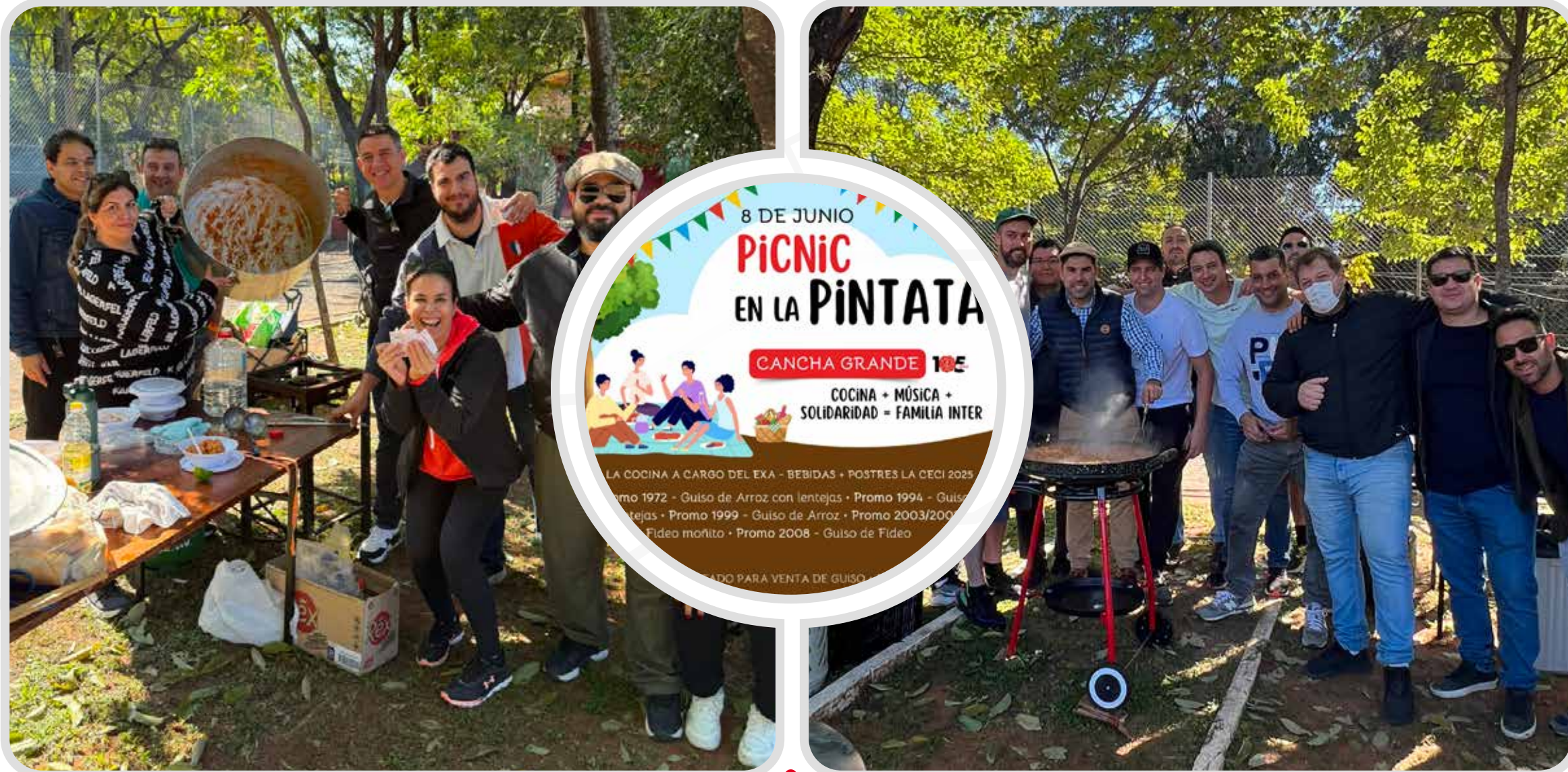
PICNIC EN LA PINTATA - COCINA SOLIDARIA Y DONACIÓN A FUNDACION RENACÍ